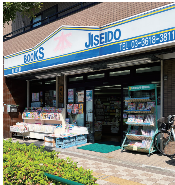
自成堂 ●墨田区立花2-4-2 ●営業時間：8:30～20:00 ●定休日：日曜