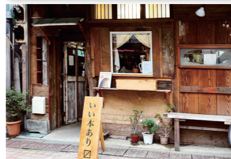
kamos ●墨田区京島3-48-1 ●営業時間：月・水曜 15:00～19:00 土・日曜 13:00～18:00

商店街を見守る田丸稻荷神社のある原公園。そんな公園で読むとしたら？ Kamosの柳下さんが選んだのは『世界をきちんとあじわうための本』。『エッセイでも哲学書でもなく、日常の中の気づきを得られたり、何か視点が変わる』そんな本だそうです。ゆったりとした時間が流れる公園のベンチに座って読めば新たな気づきがあるかもしれません。