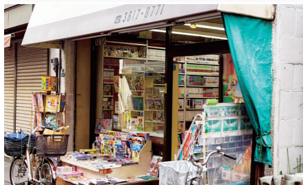
ブックス栄真堂 ●墨田区京島3-19-4 ●営業時間：10:00～20:00 ●定休日：年中無休

本を買ったら、商店街の中にある三角広場へ足を運んでみるのもおすすめです。かつて交番があった場所を活用した小さな広場には人工芝と手づくりのベンチが置かれ、地域の憩いの場になっています。お気に入りの一冊を手に、ベンチに腰掛けてページをめくる。そんな穏やかな時間が似合う風景が、京島には今も残っています。