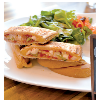
「マルゲリータサンド」¥850 本格的なイタリアンの味わい、チーズもたっぷりで大満足! サラダにかかったこだわりの自家製ドレッシングも好評!