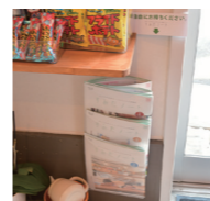
ちなみに、すみだノートスポットG3(ジースリー)となっていますので、最新号から3号前までが置かれています。ご来店の際は是非手に取ってください。