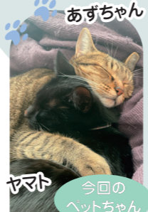
あずちゃん 今回のペットちゃん あずきと ヤマトはお家の軒下で拾われたおそろく姉妹猫。

「昨年9月にすみだへやってきました。私がすみだでたいやきと「コーヒー」のお店をしようとしたこともあり、キジトラには「あまのた」。当初お向かいさんが引き取るまで預かる予定だった黒猫は、仮名のつもりで「ヤマト」と名付けましたが、仲良しの2匹を引き離せず結局一緒に迎えることになりました。