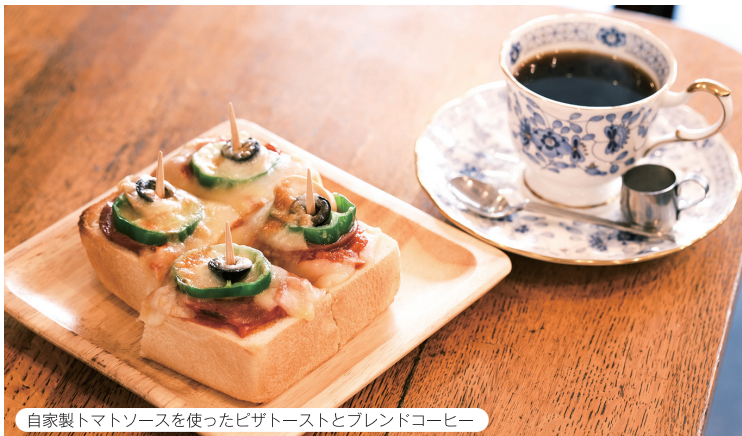
自家製トマトソースを使ったピザトーストとブレンドコーヒー

墨田区のおしゃれなカフェや老舗喫茶店など、美味しいドリンクやスイーツをいただきながら至福のひとときを過ごせるカフェをご紹介します。