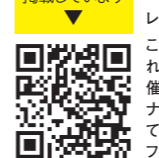
すみだノート Webサイトにも掲載しています

調理のポイント 量を増やす時は、卵一個ずつ、レンジで加熱すると、ふくらみやすいです。