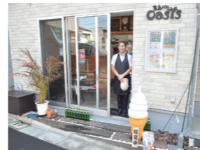
「京島バルOasis」 墨田区京島3-18-1 1F 090-7013-2609 ランチ 11:00~17:00 夜バル 17:00~ 定休日: 水曜