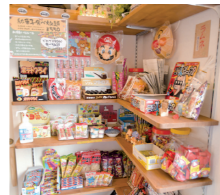
1ドリンク+550円で90分駄菓子を食べ放題! (小学生は350円、未就学児は無料) 絶賛改装中の「Cggh(ちがぐはぐ)」も今春、駄菓子屋をオープン予定なので、なんと徒歩30秒圏内に2軒の駄菓子屋ができることになりました。

いから、店内には駄菓子コーナー、夜の営業時は、BGMに昭和歌謡が流れます。実際に取材中も近所の方が来店したり、予約の注文が入ったりしていました。