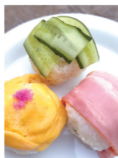
レシピ監修: 後藤由里 こどもたちのクッキング教室「まじかるれっすん やさしいおうちゅう舟教室」を主催。全寮制の学校給食、インターナショナルスクールのベジタリアンシェフを経て独立、自然食カフェ、野菜を食べるカフェを13年間経営。

調理のポイント 量を増やす時は、卵一個ずつ、レンジで加熱すると、ふくらみやすいです。