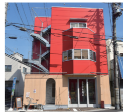
赤い3階建の建物の一階を覗くと「京島三丁目北町会」と書いてあり、中には御神輿が格納されています。

今回ご紹介するのは、京島3丁目にある、すみだノート編集部のある『Caggh(ちがぐはぐ)』と同じ通りに昨年オープンしたお店『京島バル Oasis』。